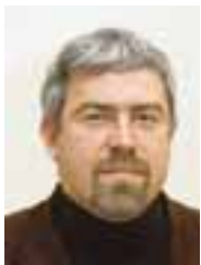
PIŠE: IVAN KNEŽEVIĆ

Republika Srbija učestvuje u programima prekogranične saradnje Evropske unije od 2004. godine. Prema podacima Odeljenja za prekograničnu saradnju Ministarstva finansija, u periodu od 2004. do 2006. EU je kroz program pomoći CARDS omogućila učešće Srbije u pet programa prekogranične saradnje, i to sa Mađarskom (četiri miliona evra), sa Rumunijom (5,6 miliona evra), sa Bugarskom (četiri miliona evra), u Jadranskom programu (milion evra) i programu CADSES (1,1 milion evra).