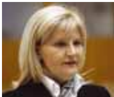
PIŠE: DR TANJA MIŠĆEVIĆ

Za ubrzanje procesa evropske integracije – koji očigledno kasni – postoje dva osnovna preduslova: jedan je politički konsenzus o tome šta je proces evropske integracije, a drugi tehnički preduslovi za praktično sprovođenje ovog ubrzanja.