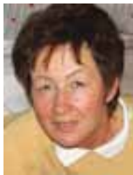
PIŠE: EDINA POPOV

U Asocijaciji potrošača Srbije mislimo da su evropski kriterijumi zaštite potrošača pravljani baš po našoj meri. Posebno nam se sviđa politika koja smatra da je na pijaci (tržištu) i potrošač ravnopravan sa moćnim učesnicima (trgovcima, bankama, kompanijama) i što mu država svojom zaštitom to obezbeđuje. Štiti potrošače zakonima, obavezujućim standardima u korist potrošača, radom posebnih državnih organa, pomaganjem samoorganizovanja potrošača radi zaštite svojih interesa i uključivanjem njihovih predstavnika u institucije gde se donose i sprovede odluke bitne za potrošače.