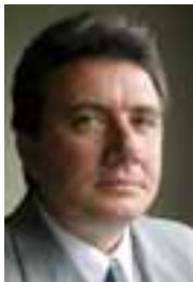
PIŠE: DR JOVAN TEOKAREVIĆ

Svaka zajednica zasnovana na pravilima podrazumeva odustajanje od dela suvereniteta, a EU nije nikakav izuzetak. Ako pak od nje još dobijate i pomoć da biste se menjali nabolje – u ovom poslu ste, moglo bi se reći, jako dobro prošli