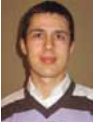
PIŠE: MIODRAG MILOSAVLJEVIĆ

Borba protiv korupcije u Srbiji bila bi unapred izgubljena izvan procesa njene integracije u Evropsku uniju. Korupcija, kao malo koji društveni fenomen, stoji na putu uspostavljanja stabilne demokratije, vladavine prava i tržišne ekonomije. Ovi kriterijumi iz Kopenhagena važe za sve potencijalne članice EU, pa tako i za Srbiju čiju je evropsku budućnost Unija nebrojeno puta potvrdila.