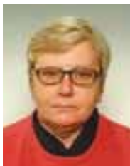
PIŠE: DR SRĐANKA TURAJLIĆ

E vroskeptici bi pitanje "Zašto je pristupanje Evropskoj uniji važno za Srbiju?" odmah preformulisali u "Šta je sveukupno važno za nauku u Srbiji?". Nema, međutim, razloga za sporenje oko formulacije, jer je odgovor ionako nemoguće izvući iz nepostojećih analiza stanja nauke u našoj zemlji, nejasne strukture izuzetno malih ulaganja u istraživanje, odsustva strategije razvoja i drugih parametara neophodnih za argumentovano zauzimanje bilo kakvog stava. Jer, Srbija ne živi na racionalnim procenama, već na predstavama zasnovanim na dva ili tri primera za koje je neko čuo.