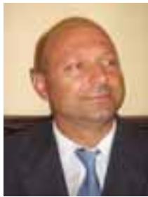
PIŠE: DR DRAGOLJUB TODIĆ

Za oblast zaštite životne sredine u Srbiji pridruživanje Evropskoj uniji i članstvo u njoj od presudnog su značaja iz više razloga. Svi oni bi se mogli sažeti u jednom stavu – da sistematski rešavaju većine aktuelnih