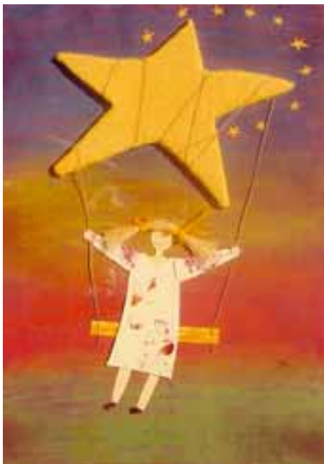
WWW.EUROPA/EU/EC, nagradni rad deteta iz Poljske

(14) razvoj uzlazne vlasti i društvene demokratije u smislu proširenja demokrat-