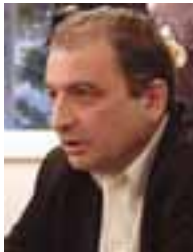
PIŠE: PROF. VLADIMIR GLIGOROV

Budući da su prošle gotovo četiri godine od pristupanja zemalja srednje Evrope i sa Baltika Evropskoj uniji i više od godine dana od učlanjenja Bugarske i Rumunije, može se već govoriti o ekonomskim posledicama integracije. Pored toga, proces učlanjenja traje relativno dugo i ima predvidljiv kraj, tako da se može govoriti i o uticaju Evropske unije na privredne prilike u zemljama praktično sve od časa kada uđu u ugovorne odnose koji za konačan ishod imaju punu integraciju. Primenjeno na Srbiju, to znači da je relevantan čitav period od potpisivanja Sporazuma o stabilizaciji i pridruživanju do konačnog ulaska u EU. To bi moglo da traje od najmanje šest godina, na koliko se Sporazum sklapa, do jedne decenije. Naravno, ukoliko se ne naiđe na veće probleme.