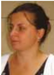
PIŠE: MARTINA VUKASOVIĆ

Značaj evropskih integracija za obrazovanje u Srbiji može se sagledati iz dva ugla: sistemsko-institucionalnog i individualnog. Pri tom, treba razdvojiti pogodnosti koje će, u sistemskom smislu, Srbija dobiti kada postane kandidat za pristupanje Evropskoj uniji od onog što će biti moguće kada Srbija postane punopravna članica EU.