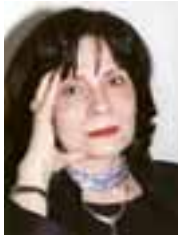
PIŠE: DR JELICA MINIĆ

Jedna od pretpostavki za uspešnu evropsku integraciju država nastalih na prostoru bivše Jugoslavije jeste regionalna saradnja. Nju je Evropska unija podsticala ranije i u srednjoj Evropi, sa istim argumentima: ne može se biti dobra zemlja članica bez saradnje sa susedima . Na Balkanu za ovo, naravno, postoje i dodatni razlozi – bezbednosno, političko i ekonomsko povezivanje trebalo je da posluži kao ključni faktor stabilnosti, pomirenja i prevazilaženja nacionalizama i netolerancije u zemljama regiona. Za razliku od nekih susednih zemalja, Srbija nije nikada imala veću odbojnost prema regionalnoj saradnji na Balkanu, pa je posle političkih promena 2000. godine bila vrlo aktivna i preuzela je mnogobrojne obaveze kako u bilateralnoj tako i u multilateralnoj saradnji u regionu.