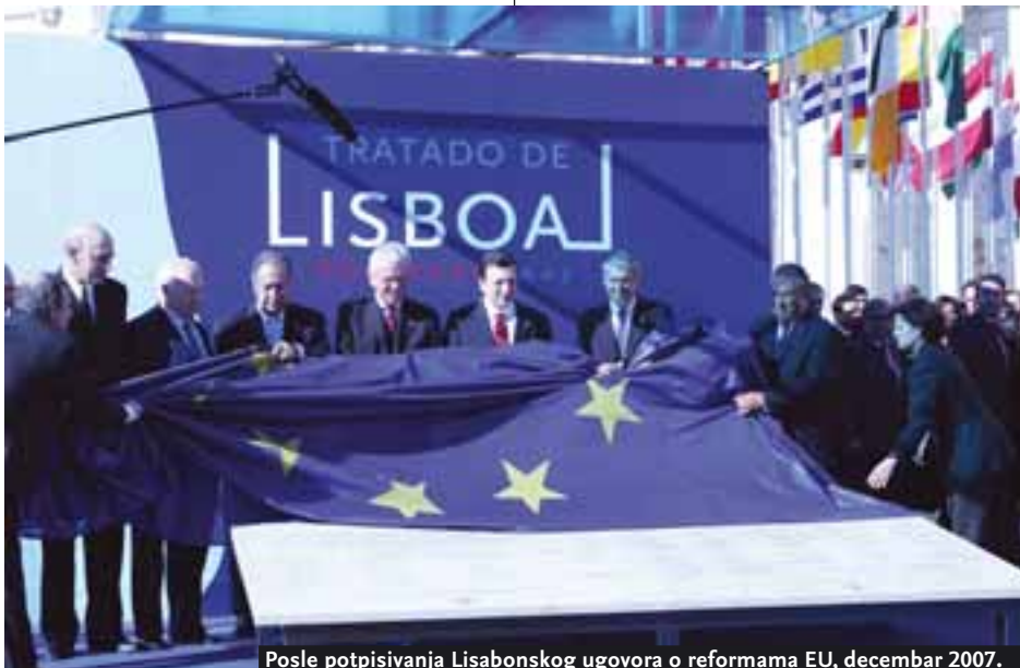
Posle potpisivanja Lisabonskog ugovora o reformama EU, decembar 2007.

pretku posebno ističe sposobnost Srbije da sprovede Sporazum o stabilizaciji i pridruživanju, a da pri tome on još nije stupio na snagu. Ili, pogledajmo pregovore o zaključenju ovog sporazuma – zvanično su otvoreni 10. oktobra 2005. godine, predviđeno je da traju do početka novembra 2006. godine, zaustavljeni su 3. maja 2006. godine, nastavljeni 13. juna 2007. godine i okončani 11. septembra 2007. Ne računajući vreme izgubljeno zbog prekida, Srbija je efektivno pregovarala o zaključenju Sporazuma manje od devet meseci, dokazujući time svoj nesumnjiv institucionalni kapacitet potreban za sprovođenje Sporazuma i brzo otpočinjanje pregovora o članstvu u Evropskoj uniji, i to u posebno teškim okolnostima.