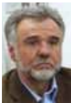
PIŠE: DR JOVAN KOMŠIĆ

Standardi života u okruženju, materijalna i organizaciona pomoć evropskih država, uključujući i perspektivu pridruživanja Srbije EU, bili su neki od najznačajnijih faktora pozitivnih promena u ekonomiji, pravu i politici nakon oktobra 2000. godine. Ratifikacija Evropske povelje o lokalnoj samoupravi, novi zakoni i ustavna garancija (2006) ograničenja državne vlasti pravom građana na pokrajinsku autonomiju i lokalnu samoupravu (Član 12) mogu se uzeti za indikatore takve "pripadnosti evropskim principima i vrednostima".