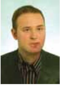
PIŠE: MR VLADIMIR TODORIĆ

Sve nove reforme koje je Srbija samomkom sprovela posle 2000. godine imale su za svoj uzor neki evropski standard i legitimitet u pridruživanju Evropskoj uniji. Reforme poreskog i bankarskog sistema, javnih nabavki, građaničnih prelaza i druge jesu neki od malobrojnih uspešnih primera, a nasuprot njima imamo obrazovanje, zaštitu konkurencije, socijalnu zaštitu i – reformu pravosuđa. Sudstvo je možda najslabija karika u lancu državnih institucija gde dolaze na sprovođenje zakoni koji su najčešće plod kompromisa između formalnih i neformalnih centara moći.