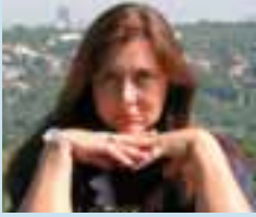
PIŠE: ALEKSANDRA MIJALKOVIĆ

Slobodno putovanje Evropom, bez viza ili čak – jednog dalekog dana – bez pasoša, kao što mogu građani EU, zasad je tek puka želja za žitelje Srbije,